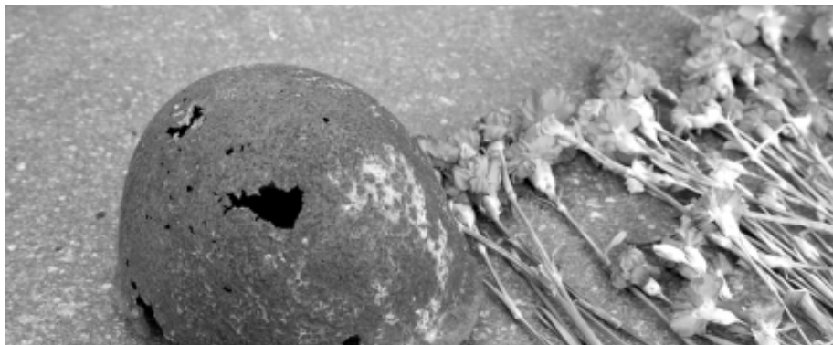
18 февраля – День поисковика Смоленской области

ГАЗЕТА МУНИЦИПАЛЬНОГО ОБРАЗОВАНИЯ «УГРАНСКИЙ РАЙОН» СМОЛЕНСКОЙ ОБЛАСТИ