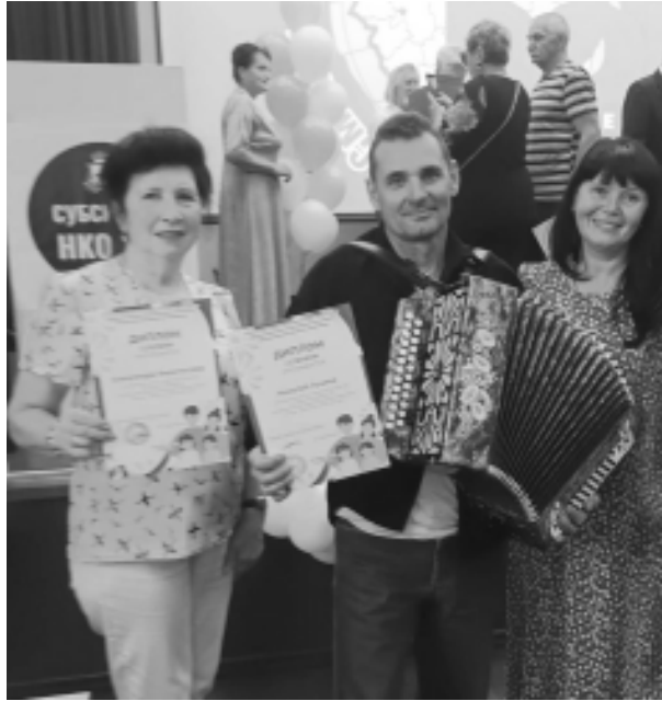
ными грамотами и памятными подарками. С. Голод