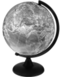
Фото из семейного архива.