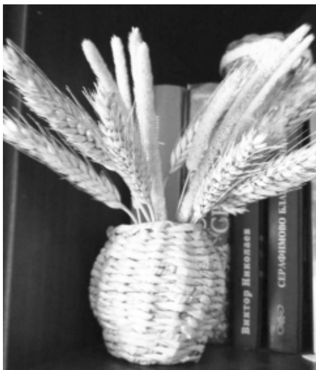
Фотографии, представленные на конкурс семьей Ванюгиных