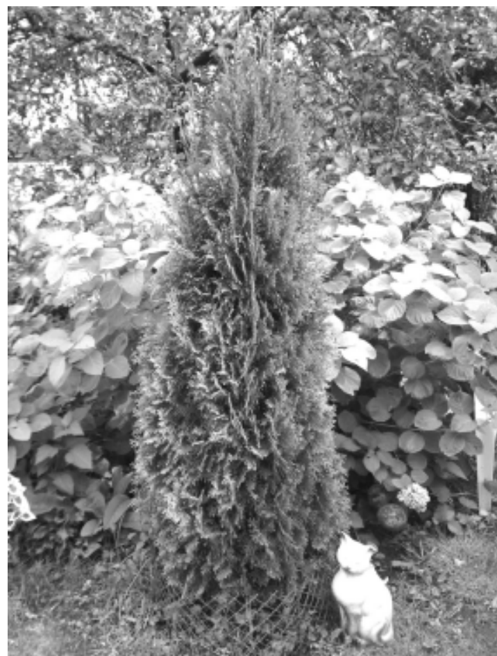
Фотографии, представленные на конкурс семьей Буренковых