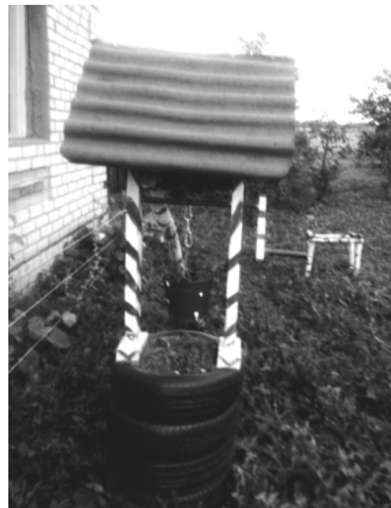
Текст и фото М. Павловой.