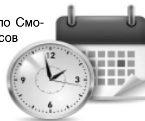
ГРАФИК проверки знаний Правил дорожного движения РФ у лиц, лишенных права управления транспортными средствами в подразделениях МОРЭР ГИБДД УМВД России по Смоленской области

ОТДЕЛЕНИЕ N 2 МОРЭР ГИБДД УМВД России по Смоленской области вторник, среда, четверг, пятница, суббота (согласно графика приема заявителей); ОТДЕЛЕНИЕ N 3 МОРЭР ГИБДД УМВД России по Смоленской области вторник, пятница с 11 часов 00 минут до 16 часов 00 минут; ОТДЕЛЕНИЕ N 4 МОРЭР ГИБДД УМВД России по Смоленской области среда, пятница с 10 часов 00 минут до 13 часов 00 минут; ОТДЕЛЕНИЕ N 5 МОРЭР ГИБДД УМВД России по Смоленской области вторник с 15 часов 00 минут до 20 часов 00 минут; ОТДЕЛЕНИЕ N 6 МОРЭР ГИБДД УМВД России по Смоленской области пятница с 10 часов 00 минут до 13 часов 00 минут.