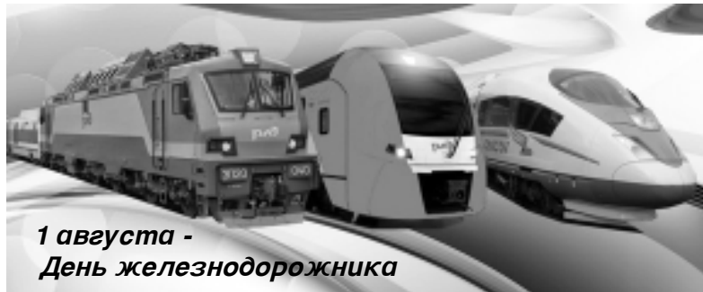
1 августа - День железнодорожника