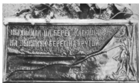
Табличка на валуне, которая в настоящее время хранится в «Мемориальном музее М.В. Исаковского» в с. Выходы