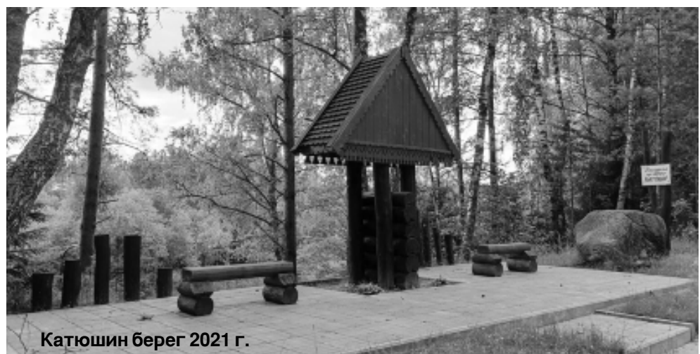
Катюшин берег 2021 г.