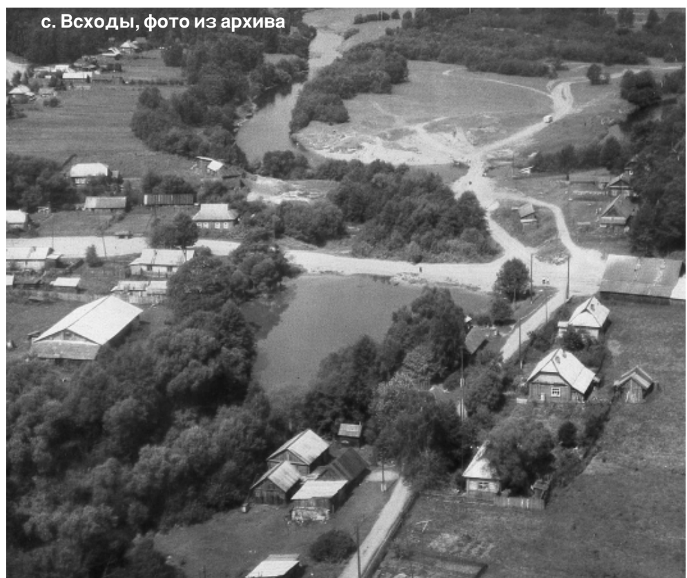
с. Выходы