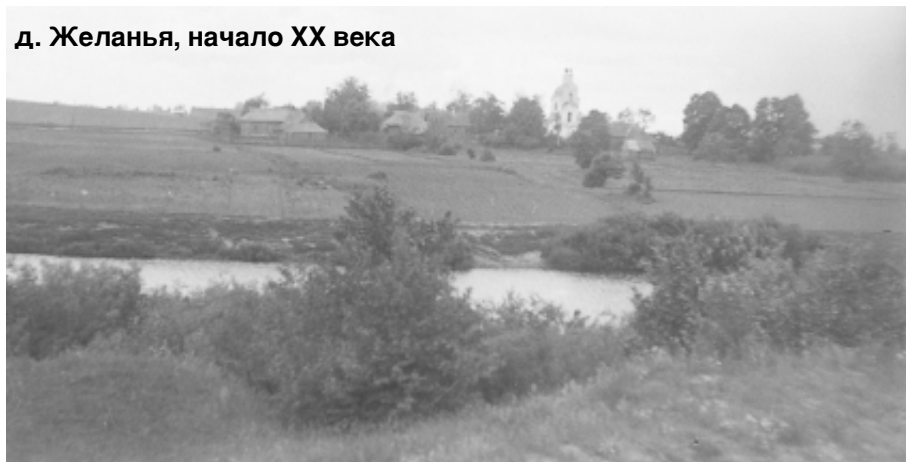
д. Желанья, начало XX века

открываемого в начале ноября лесного госпиталя для раненных окруженцев. А если говорить точнее – для людей, бежавших из лагерей и колонн военнопленных, перегоняемых из Вязьмы через Дорогобуж в Смоленск или Рославль. Это были не только раненные, но и сильно истощенные и обмороженные люди.