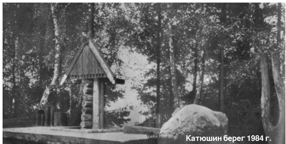
Катюшин берег 1984 г.