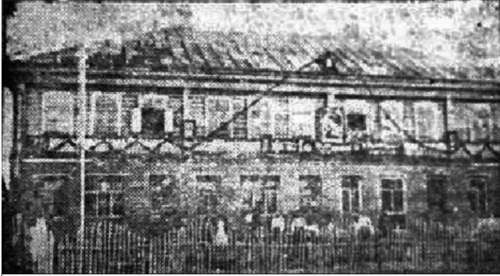
Общий вид главного здания Знаменской школы