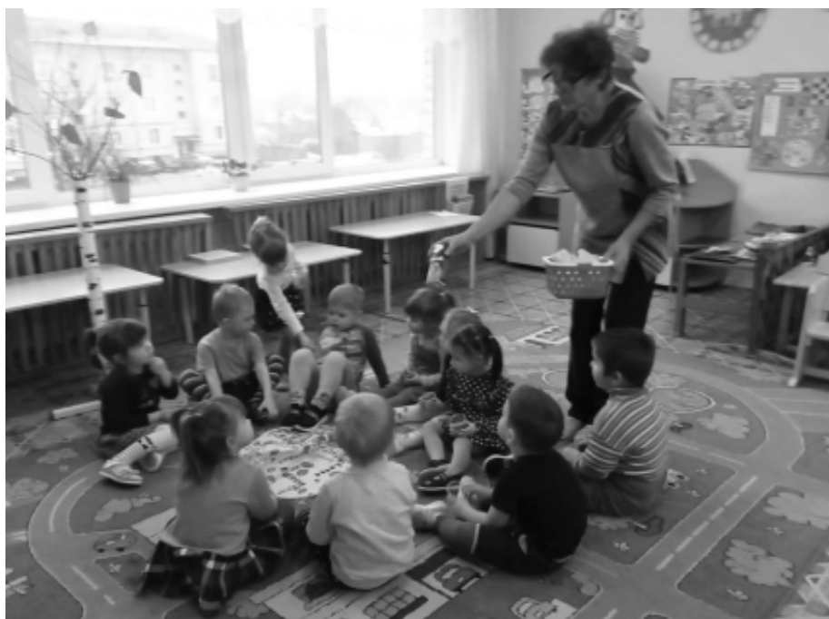
Средняя группа – сюжетно-ролевые игры - игра «В гости на день рождения к кукле Маше».

2 младшая группа - игровая деятельность. Воспитателем была представлена ролевая игра «Путешествие на лесную поляну».