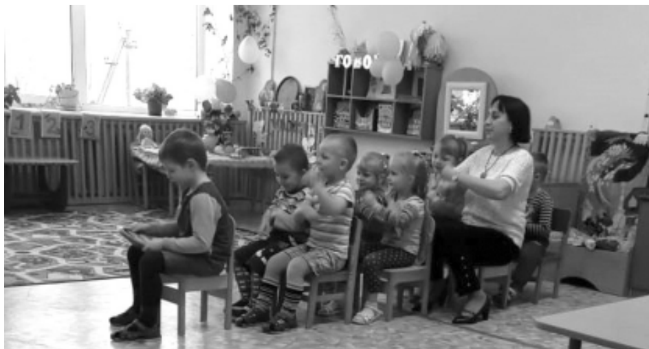
Старшая группа – организованная образовательная деятельность «Цветок дружбы».