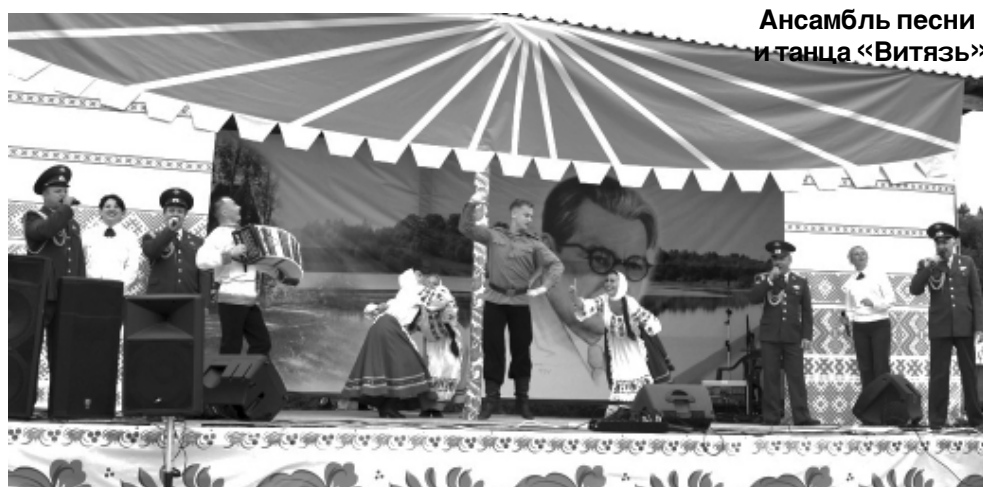
Ансамбль песни и танца «Витязь»