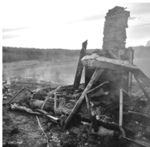
Пожар произошел 25 июля вечером в деревне Вороново Угранского района. Местные жители заметили, что на одном

из участков горит баня и сообщили спасателям.