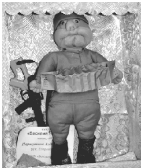
Работа, представленная на выставке

Украшением Рождественских чтений стала выставка работ обучающихся Дома детского творчества, а также концертная программа, в которой выступали учащиеся школ района, воспитанники детских садов, участники театрального кружка Дома детского творчества и работники культуры.