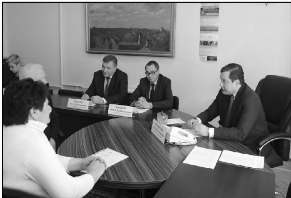
Губернатор Алексей Островский провел очередной прием граждан по личным вопросам в Приемной Администрации Смоленской области.

Участовавшие в приеме заместители Губернатора, руководители профильных Департаментов и главы муниципальных образований давали необходимые пояснения по каждому вопросу, поднятому заявителями.