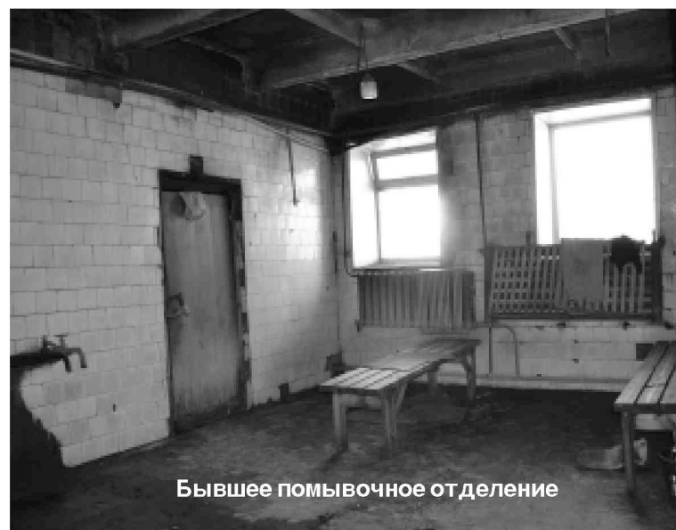
Бывшее помывочное отделение

Долгие годы угранцы были лишены возможности почувствовать все прелести банных процедур в общественной бане в райцентре. Шли в нее от крайней нужды те, кому совсем некуда было деваться. Холод, вечно текущие краны, парилка, как курная изба, не доставляли никакого удовольствия.