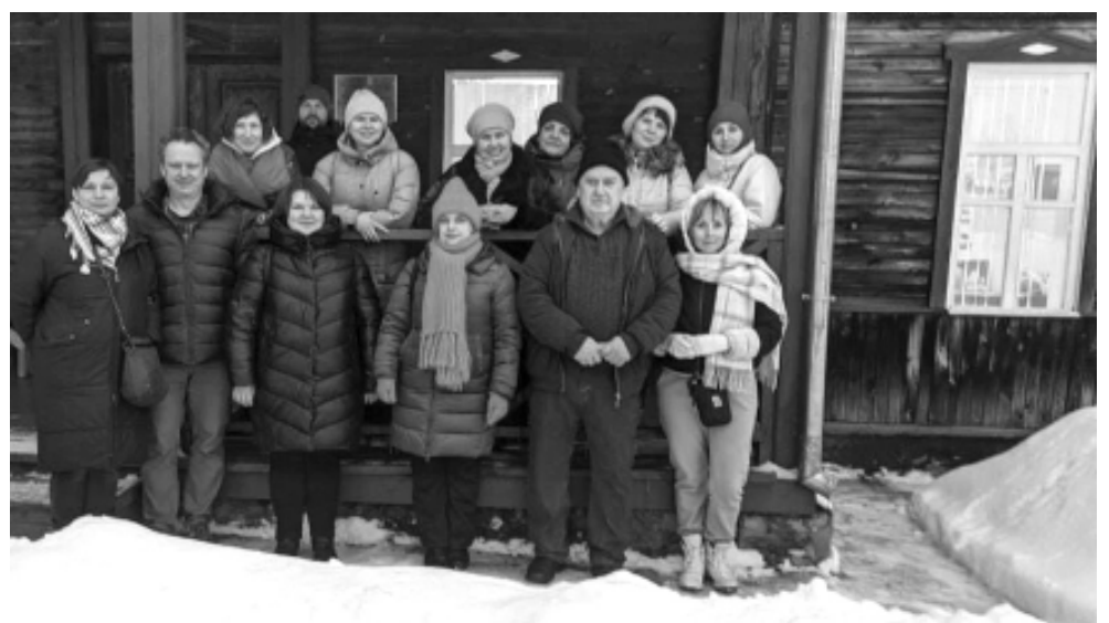
На экскурсии в Доме-музее И.С. Соколова-Микитова