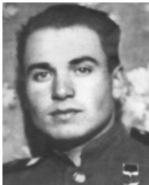
РУМЯНЦЕВ АЛЕКСЕЙ ПАВЛОВИЧ