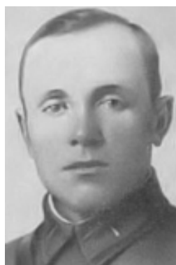
ФОКИН ГРИГОРИЙ НИКОЛАЕВИЧ

01.11.1943 г. присвоено звание Героя Советского Союза.