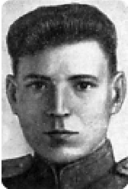
АЗАРОВ ПЕТР ЛУКЬЯНОВИЧ

Родился 14.08.2022 г. в д. Зиновино Архамоновского с.с. С ноября 1942 года летчик бомбардировочной авиации сражался с захватчиками на Южном, 4-м Украинском и 3-м Белорусском фронтах. Награжден 2-мя орденами Красного Знамени.